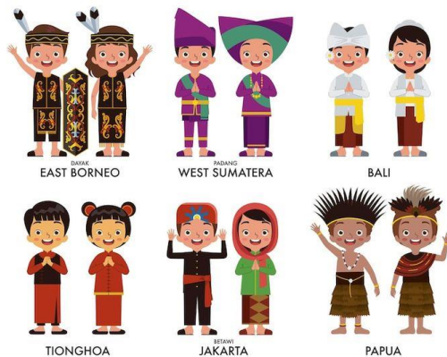
Gambar Baju Adat Budaya Indonesia 8