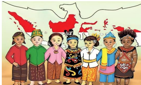
Gambar. Budaya Indonesia 7

Tionghoa jumlahnya 2.832.510 jiwa atau 1,2 persen penduduk Indonesia. 6